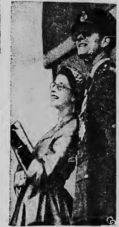
KONINGIN ELIZABETH en de Hertog van Edinburgh sloegen de oefeningen van de luchtmacht, welke boven Odham werden gehouden, gade. Aan de oefeningen namen 650 toestellen deel. De luchtmacht-oefening was bedoeld als tegenhanger van de grote vlootshow, die ter ere van de Kroning werd gehouden.

WASHINGTON. Het onafhankelijke lid van de Amerikaanse Senaat, Wayne Morres, heeft meegedeeld, dat hij zich moreel verplicht voelt over organisatorische kwesties met de Republikeinen mee te stemmen. Hierdoor is het vrijwel zeker, dat ook na de dood van Senator Taft de Republikeinen hun meerderheid in de Senaat zullen behouden.